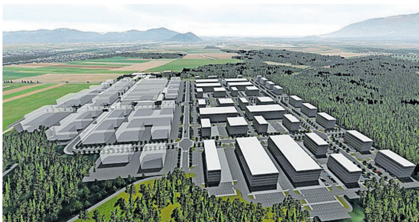
Mestna občina Kranj je pridobila pravnomočno gradbeno dovoljenje za gradnjo javne infrastrukture v Poslovni coni Hrastje. Na sliki vizualizacija cone.

Na občini so tudi v letu 2023 utrjevali položaj Kranja v misiji 100 podnebno nevtralnih in pametnih mest do leta 2030. MOK je zgradila prvo parkirišče P + R (parkiraj in prestopi) na Gorenjskem s 56 parkirnimi mesti,