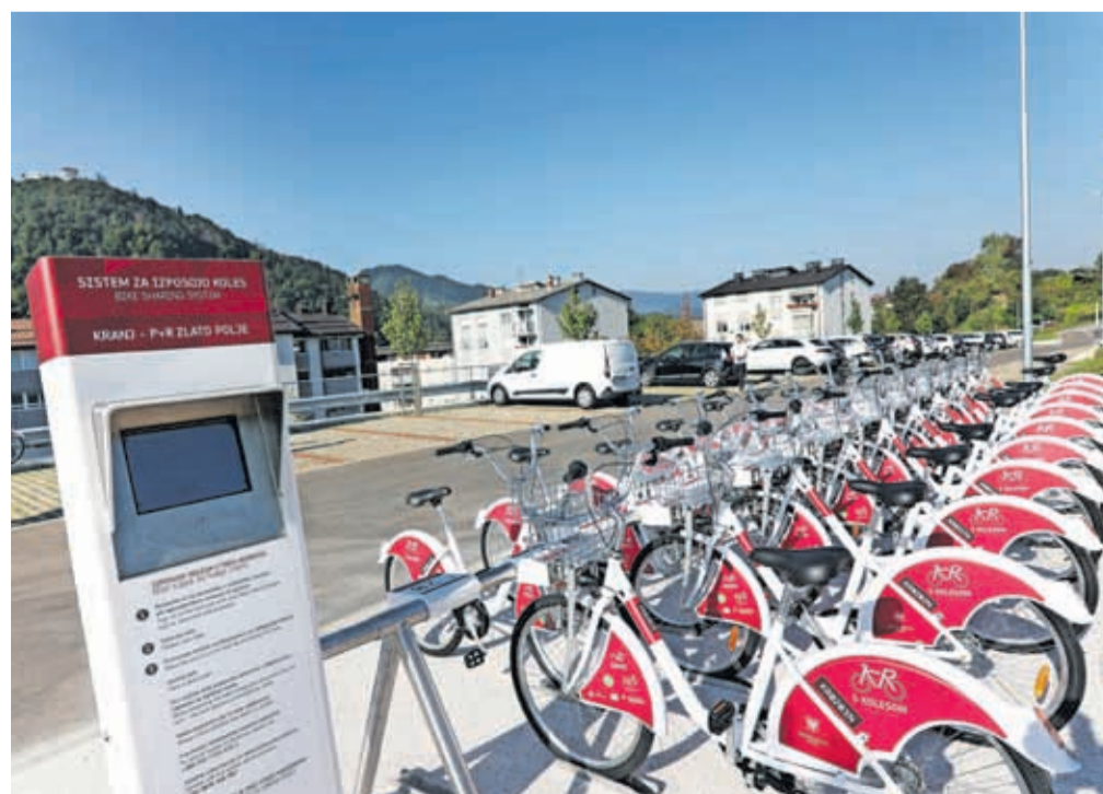
Na parkirišču P + R na Zlatem polju s 56 parkirnimi mesti je tudi novo postajališče sistema KRskOLE-SOM.