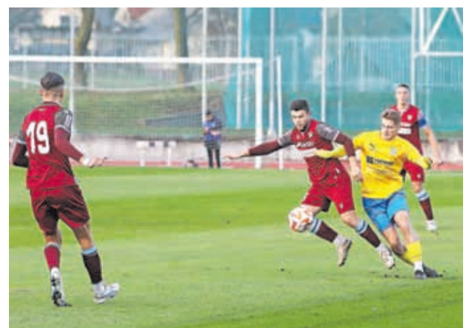
Nogometaši Triglava so na zadnji tekmi jesenskega dela na domači zelenici premagali goste iz Beltincev.