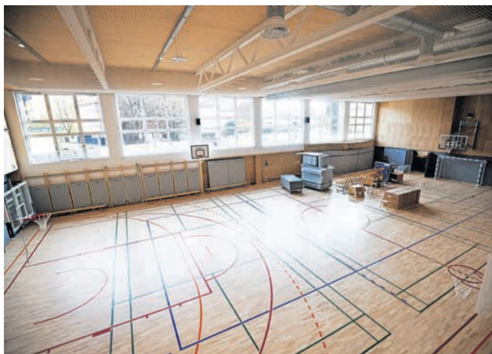
Na področju šolstva izstopa gradnja in opremljanje prizidka k OŠ Staneta Žagarja Kranj.

Nova turistična pridobitev v Kranju je od letos Jenkova rezidenca v starem mestnem jedru, v kateri je nekoč bival Simon Jenko. Ta ohranja kulturno dediščino, hkrati pa poudarja trajnostne smernice bivanja. Za trajnostni razvoj v turizmu je Kranj letos prejel platinasti znak, najvišji v okviru zelene sheme slovenskega turizma. Info center SOS proteus, v katerem biologi Zavoda Jamski laboratorij Tular izobražujejo obiskovalce o človeški ribici in pomenu podzemnih voda, se je uvrstil