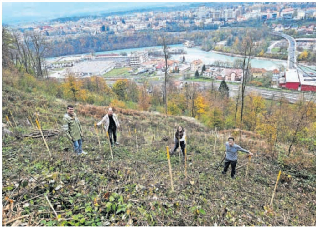
Na pobočju Šmarjetne gore, na območju, ki sta ga načela žledolom in lubadar, je Mestna občina Kranj zasadila tristo sadik oreha, divje češnje, pravega kostanja in lipe.

Tretje leto zapored so občanke in občani vseh 26 krajevnih skupnosti imeli možnost predlagati projek-