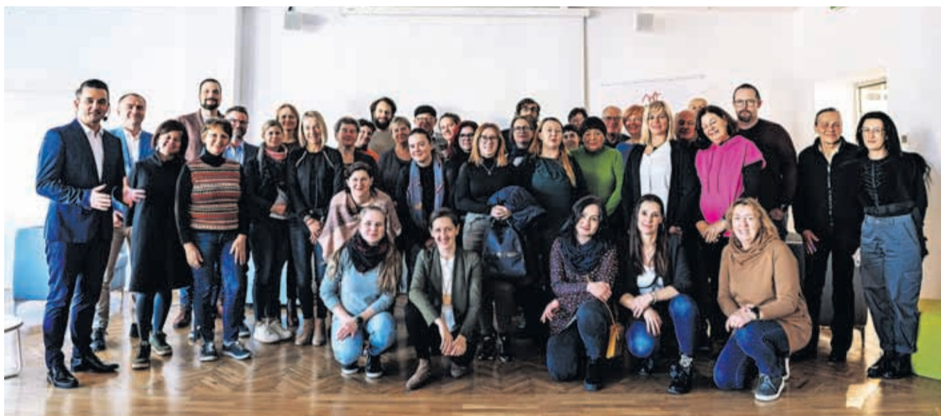
Dne 24. novembra je v kranjski Kovačnici v organizaciji Zavoda za turizem in kulturo Kranj potekal Kranjski turistični forum, kjer so se zbrali kolegi iz turističnega sektorja.

ki ga imajo le še štirje drugi slovenski kraji. Ta sega širše od enega trajnostnega turističnega produkta. Gre za trajnostna prizadevanja na različnih področjih v destinaciji, ki morajo dosegati dovolj visoko kakovost, predvsem pa kontinuiteto. Zato imamo v Kranju zeleno ekipo, sestavljeno iz 21 članov iz različnih institucij. Ekipa spremlja stanje, določa ukrepe in spodbuja različne deležnike, da bi se ti z različnimi certifikati zavezali trajnostnemu delovanju. Konec novembra smo tako Mestnemu svetu MOK uspešno predstavili akcijski načrt upravljanja in razvoja Kranja kot trajnostne destinacije do leta 2026. Ta v okviru trajnostnega turizma vključuje tudi ekonomski, družbeni in okoljski vidik. Okoljski certifikati so bili tudi ena izmed treh tem, o katerih smo konec meseca govorili na Kranjskem turističnem forumu. Enkrat letno namreč Zavod za turizem in kulturo Kranj povabi na druženje ves turistični sektor in ostale deležnike, s katerimi v destinaciji kreiramo turistično ponudbo. Poleg trajnostnih tem smo se tokrat dotaknili še trendov digitalnega marketinga v turizmu, največ časa pa smo namenili kulturnemu turizmu. Slovenska turistična organizacija je namreč za osre-